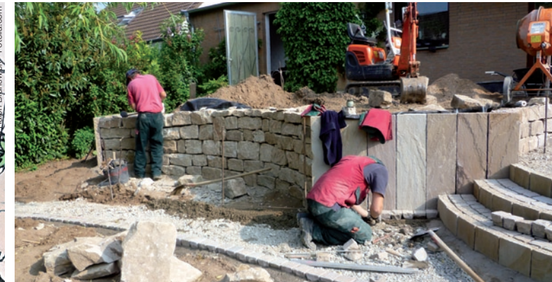
KOMBINATION VON BEISPIEL 1 UND BEISPIEL 2: